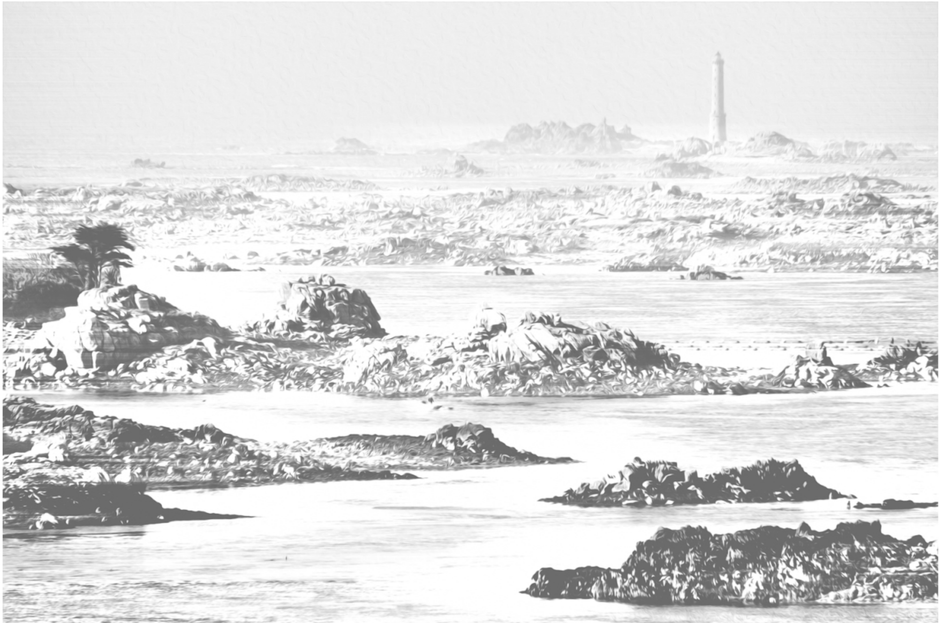
Ploubaz 1.0 A dessiner