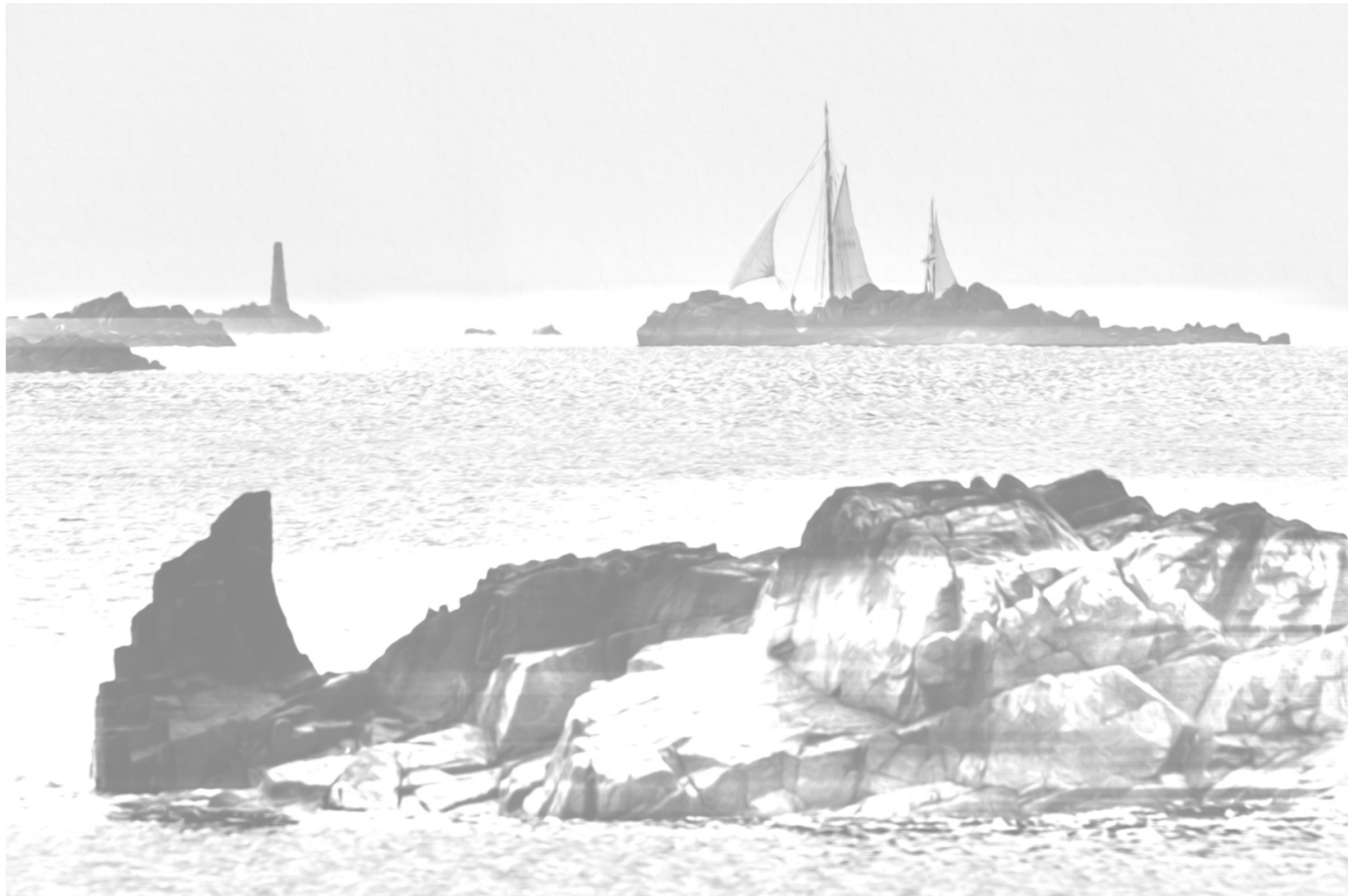
Ploubaz 1.0 A dessiner